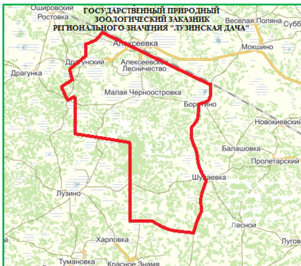
Карта территории государственного природного зоологического заказника регионального значения «Лузинская дача»

Территория заказника расположена Любинском районе Омской области. Заказник существует с 1995 года. До 2012 года его площадь составляла 2 тыс. га, тогда как в 2012 году его территория увеличилась до 30,4 тыс. га.