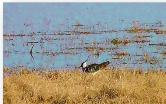
Чибис ( Vanellus vanellus )

Из животных, занесённых в Красную книгу Омской области здесь встречаются: большой подорлик ( aquila clanga ), сокол сапсан ( falco peregrinus ), лебедь-кликун ( cygnus cygnus ), серая куропатка ( perdix perdix ), тушканчик большой ( allactaga major ) и др.