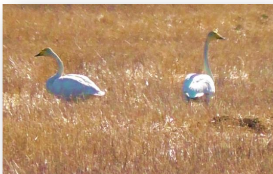
Лебедь-кликун ( Cygnus cygnus )