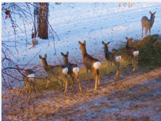
Косуля сибирская ( Capreolus pygargus )