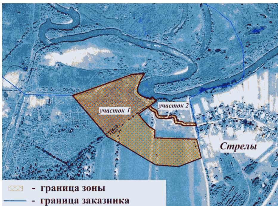
Схема границ зоны

Приложение к постановлению Правительства области от 21.09.2018 N 693-п