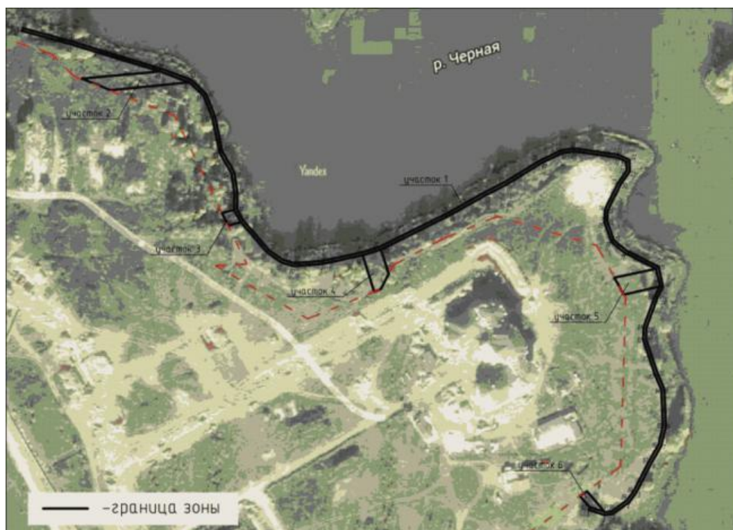
Схема границ зоны