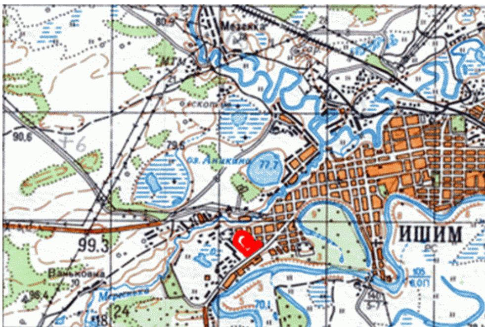
ОБЗОРНАЯ КАРТА ПАМЯТНИКА ПРИРОДЫ РЕГИОНАЛЬНОГО ЗНАЧЕНИЯ "БЕРЕЗОВАЯ РОЩА" М 1:50 000