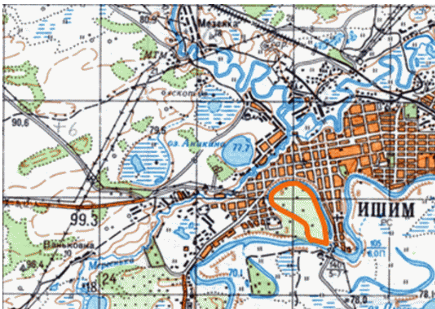
ОБЗОРНАЯ КАРТА ПАМЯТНИКА ПРИРОДЫ РЕГИОНАЛЬНОГО ЗНАЧЕНИЯ "НАРОДНЫЙ ПАРК" М 1:50 000