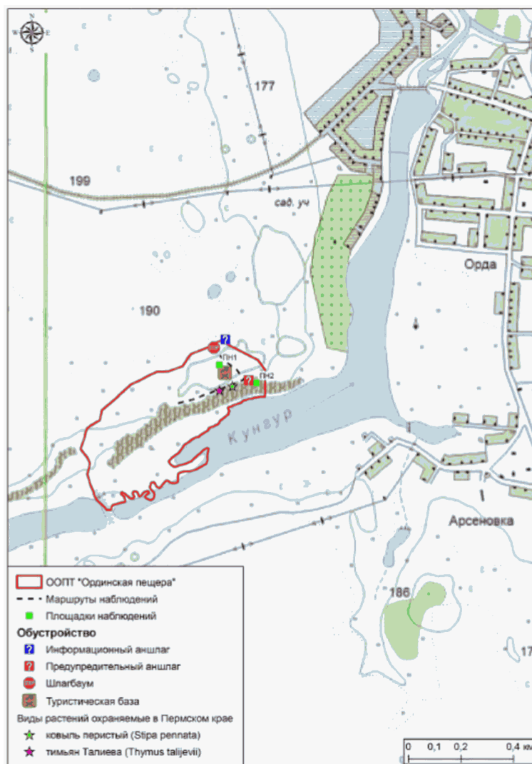
Схема геологического памятника природы "Ординская пещера"

Приложение: Схема геологического памятника природы "Ординская пещера" с нанесением на ней всех площадок и маршрутов наблюдений, существующего обустройства, видов растений, охраняемых в Пермском крае.