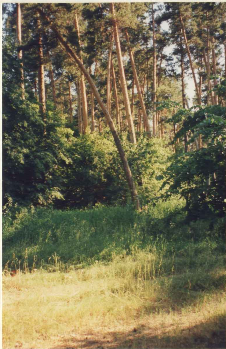
Место для фотографий, иллюстрирующих состояние государственного памятника природы в момент составления паспорта.

Запрещено все виды работ, кроме необходимых для серв- танса дикорастущих.