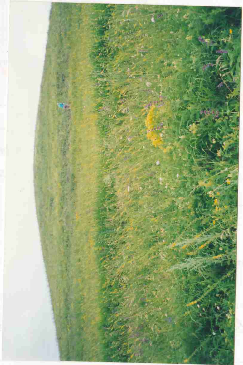
Место для фотографий, иллюстрирующих состояние государственного памятника природы в момент составления паспорта.