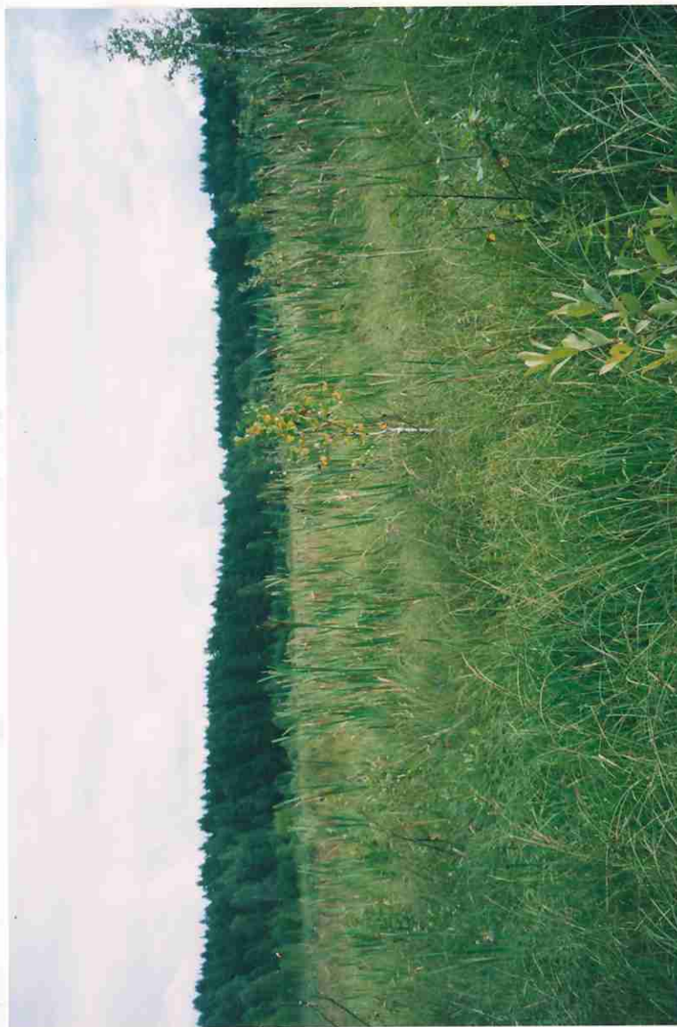
Место для фотографий, иллюстрирующих состояние государственного памятника природы в момент составления паспорта.