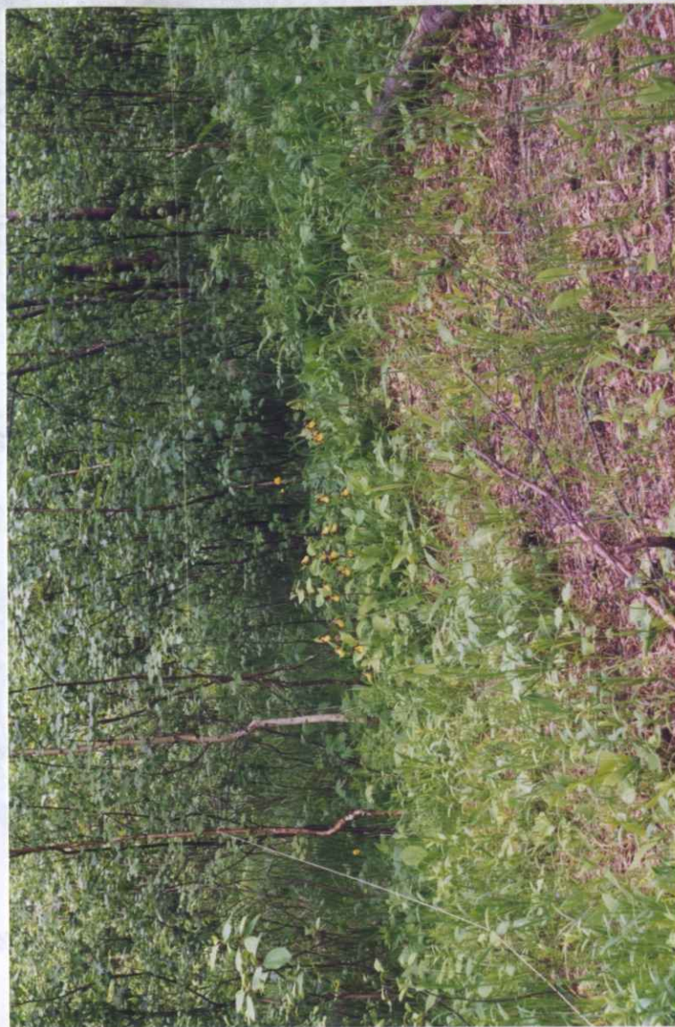
Место для фотографий, иллюстрирующих состояние государственного памятника природы в момент составления паспорта.

- все виды изыскательских, строительных, земляных и других работ