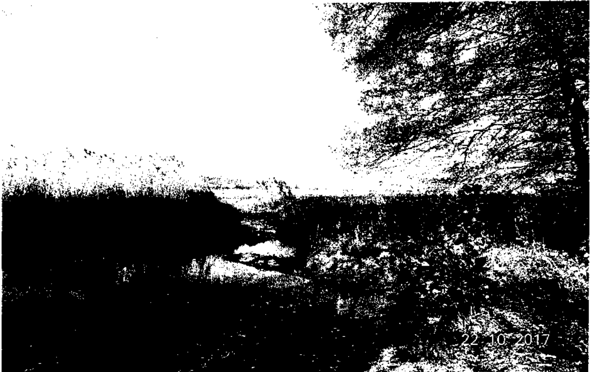
Фото 1. Озеро Маковье