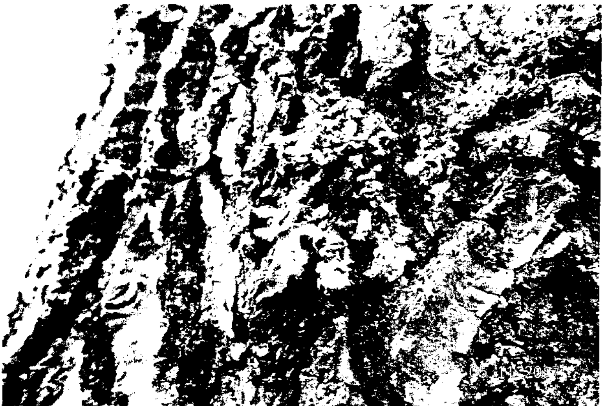
Фото 2. Обилие лишайников на коре деревьев – индикатор чистоты атмосферы