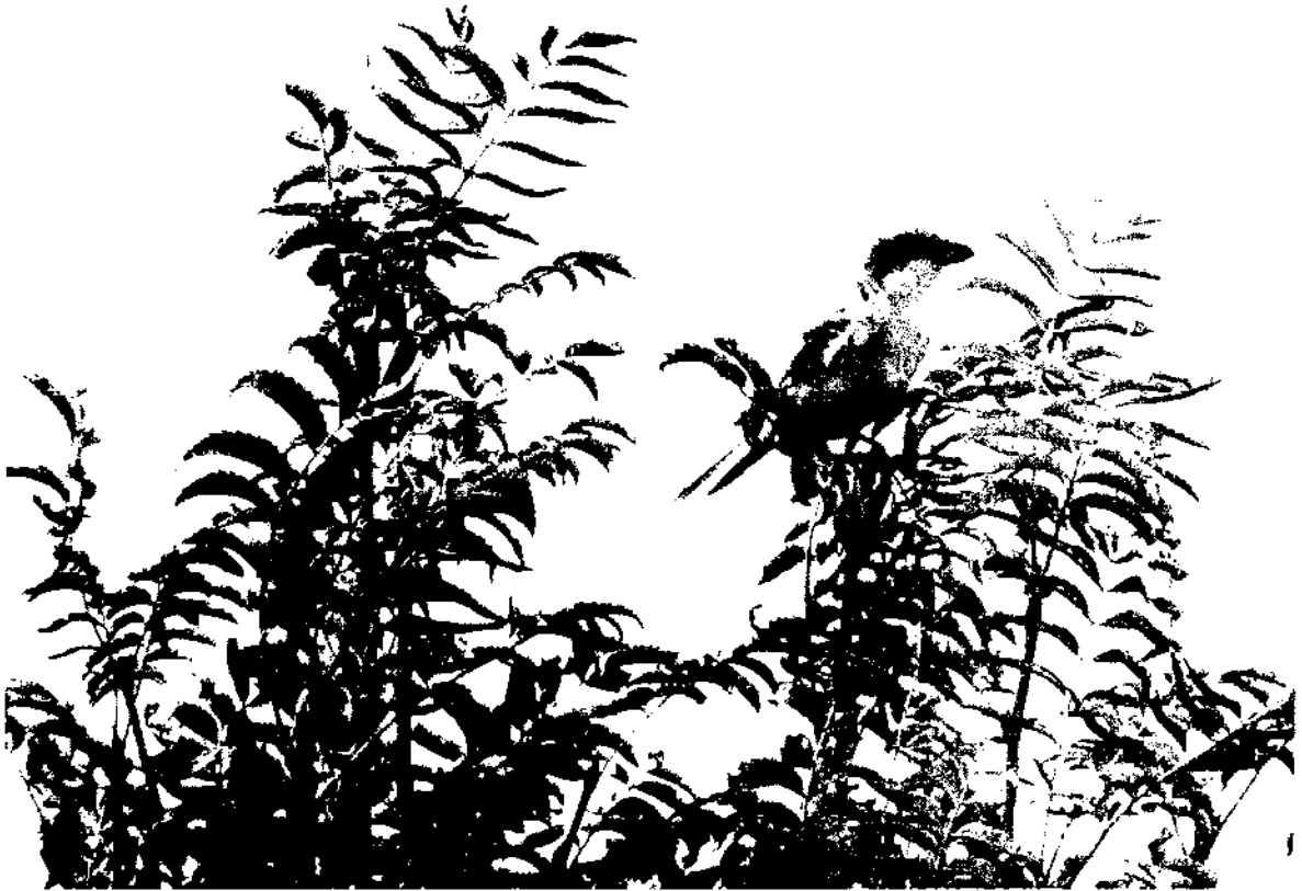
Фото 3. Сорокопут серый