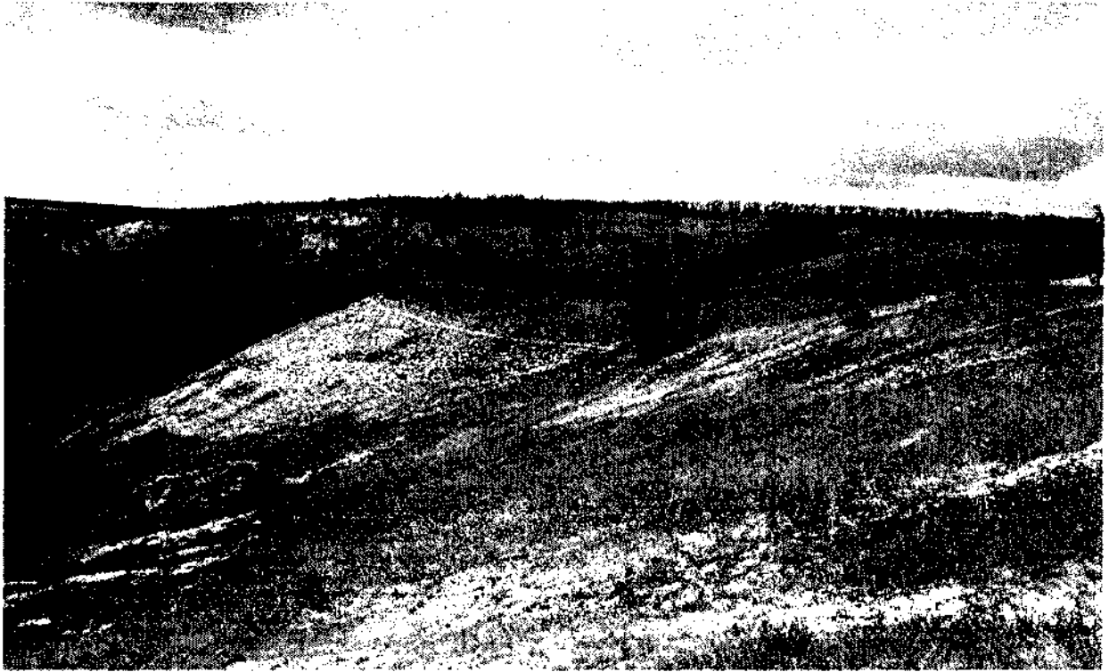
Фото 1. Общий вид