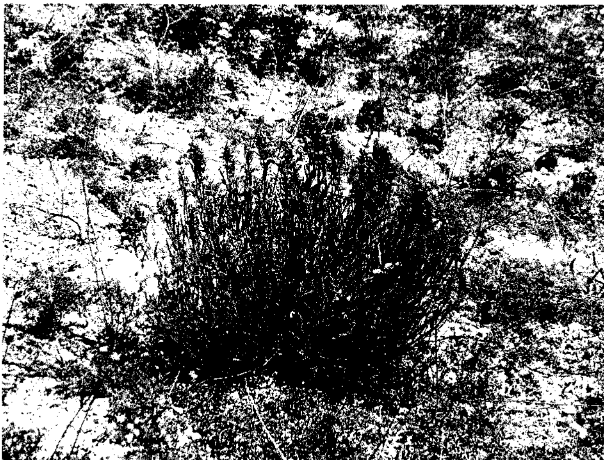
Фото 3. Иссоп меловой