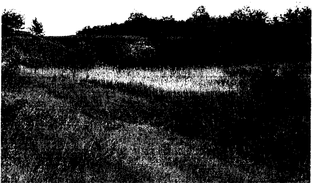
Фото 2. Висячее болото на склоне долины р. Мелавки