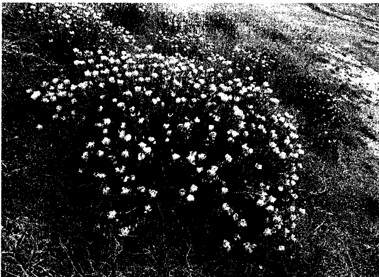
Фото 5. Ракитник австрийский