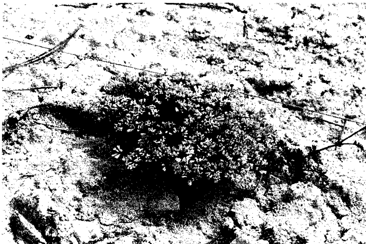
Фото 4. Ясменник сероплодный