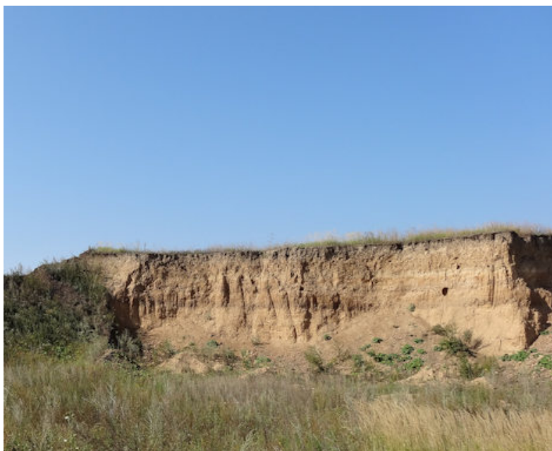
Фото 3. Характерный участок палеобалки