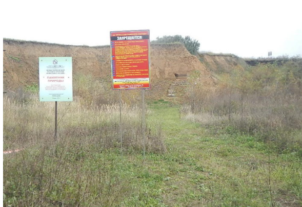
Фото 5. Обозначение границ памятника природы на местности

Утвержден постановлением Администрации Курской области от 31 мая 2019 г. N 491-па