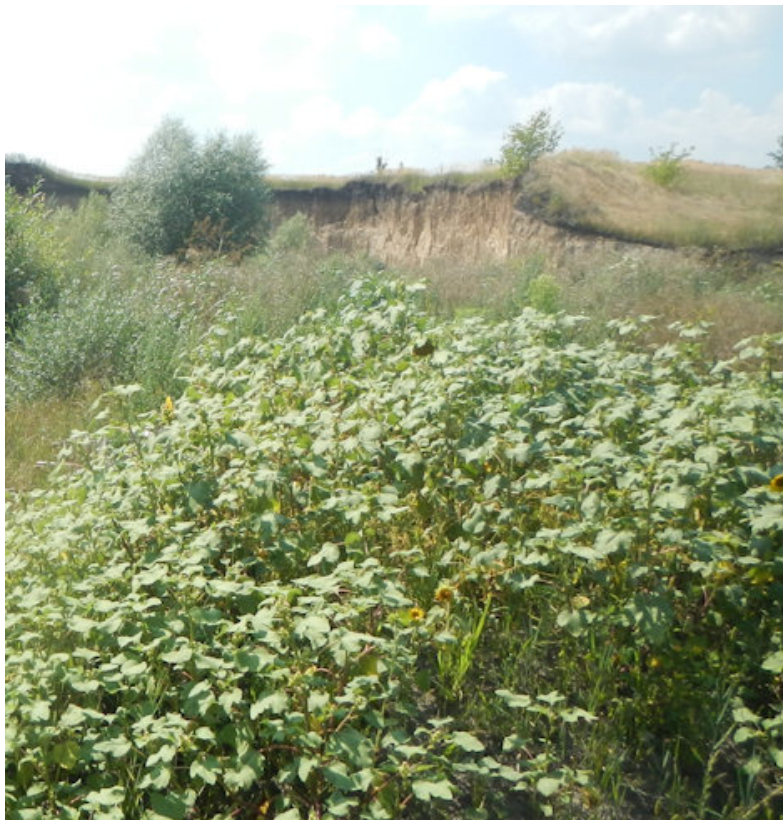
Фото 2. Окрестности палеобалки