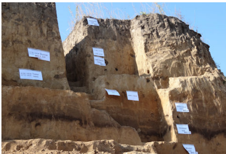
Фото 4. Почвенный профиль