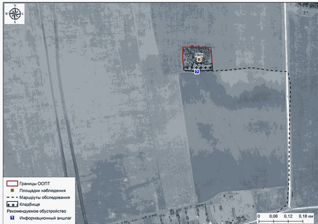
Схема ботанического памятника природы "Лиственничная роща"

Приложение: Схема ботанического памятника природы "Лиственничная роща" с нанесением на ней всех площадок и маршрутов наблюдений, видов растений, охраняемых в Пермском крае.