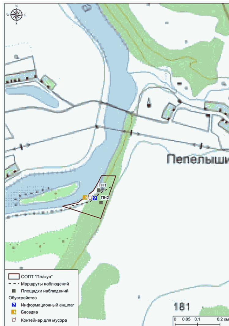
Схема ландшафтного памятника природы "Плакун"

Приложение: Схема ландшафтного памятника природы "Плакун" с нанесением на ней всех площадок и маршрутов наблюдений, существующего обустройства, видов растений, охраняемых в Пермском крае.