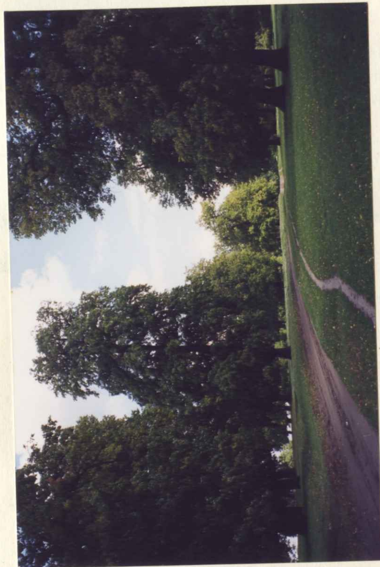
Место для фотографий, иллюстрирующих состояние государственного памятника природы в момент составления паспорта.

- запрещено: рубка деревьев, разведение костров, проезд на автомашинах