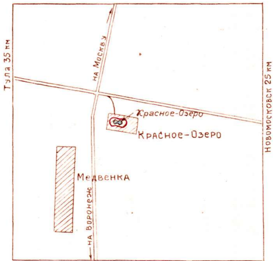
Схема местоположения охраняемого объекта „Красное Озеро“