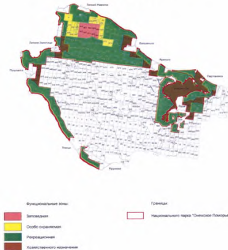
КАРТА-СХЕМА ФУНКЦИОНАЛЬНОГО ЗОНИРОВАНИЯ ТЕРРИТОРИИ НАЦИОНАЛЬНОГО ПАРКА «ОНЕЖСКОЕ ПОМОРЬЕ»