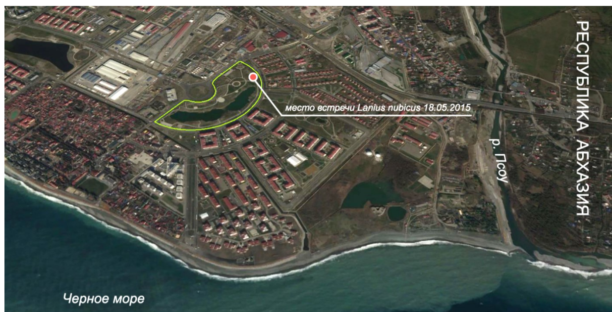
Рис. 1. Место встречи маскированного сорокопута Lanius nubicus (зелёной линией показана граница территории кластера №7 природного орнитологического парка в Имеретинской низменности).

Первые две самки маскированного сорокопута Lanius nubicus на территории Краснодарского края добыты во время экспедиции 30 мая 1998 Ю.В.Лохманом, И.В.Фадеевым, Е.В.Нестеровым, И.Ю.Карагодиным и С.В.Дровецким на Бугазской косе, в 11 км к юго-востоку от станции Благовещенская. Сначала они были определены как красноголовые сорокопуть Lanius senator . Однако при последующей научной обработке коллекции тушек они были переопределены как маскированные сорокопуть (Лохман и др. 2005). Кроме того, сообщалось о залёте маскированного сорокопута на Нахичеванскую равнину в 2009 году (Султанов, Мамедов 2009). На Имеретинской низменности маскированный сорокопуть никогда ранее не отмечался (Тильба, Борель, Шагаров 2014).