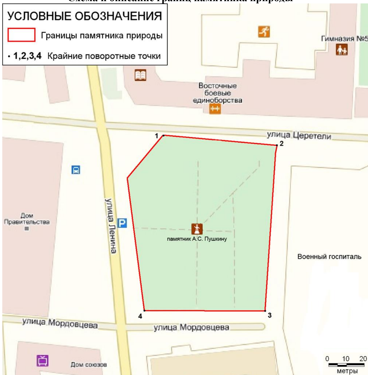
Схема и описание границ памятника природы

Организация, в ведении которой находится памятник природы: Комитет Республики Северная Осетия-Алания по охране окружающей среды и природных ресурсов.