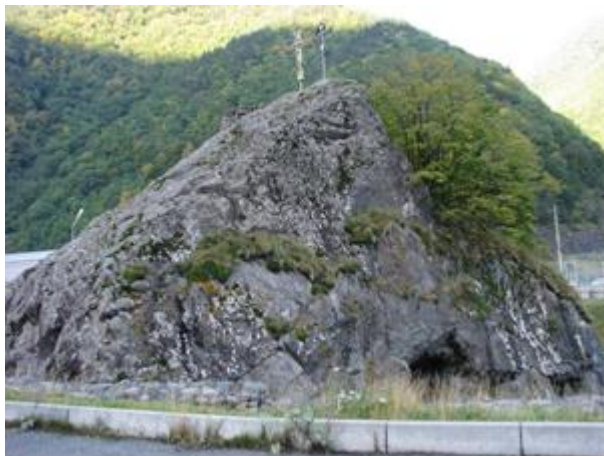
Параметры занимаемого памятником природы земельного участка