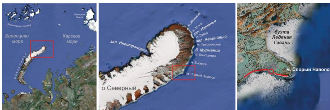
Рис. 1. Район обследования береговой зоны и сбора макрофитов на северо-восточном побережье о. Северный архипелага Новая Земля в августе 2012 г. Обследованная часть побережья выделена красной линией, место отбора проб водорослей из штормовых выбросов – красным кружком

В ходе экспедиционных работ ААНИИ и ПИНРО в Карском море на НИС "Фритьоф Нансен" в августе 2012 г. была проведена кратковременная высадка на северо-восточное побережье о. Северный архипелага Новая Земля для обзорного исследования береговой зоны (рис. 1).