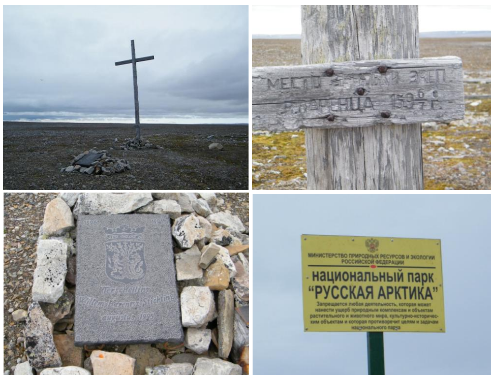
Рис. 2. Место зимовки экспедиции В. Баренца в 1596-97 гг. на берегу бухты Ледяная Гавань. Мемориальный крест и доска установлены на месте зимовки и находятся на территории национального парка "Русская Арктика"

бухты Ледяная Гавань входит в состав территории национального парка "Русская Арктика" (рис. 2). Участок береговой линии был детально обследован на предмет развития литоральной флоры и фауны. В данной работе представлены результаты обработки небольшой коллекции макроводорослей из этого уникального района.