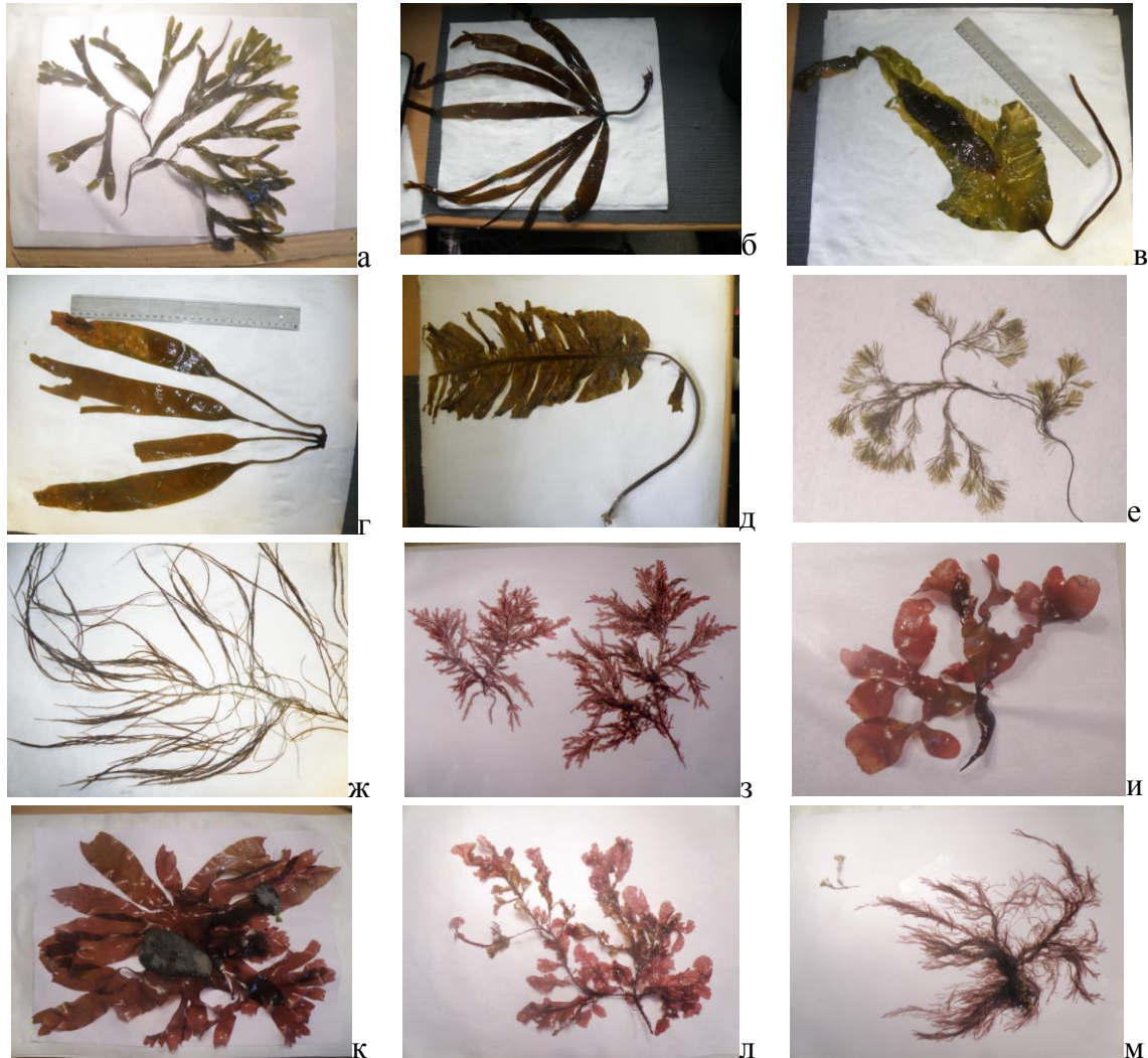
Рис. 4. Макроводоросли из района бухты Ледяная Гавань (о. Северный, Новая Земля, Карское море): а – Fucus distichus ; б – Laminaria digitata ; в – Laminaria saccharina ; г – Saccorhiza dermatodea ; д – Alaria esculenta ; е – Sphacelaria plumosa ; ж – Desmarestia aculeata ; з – Ptilota plumosa ; и – Coccotylus truncatus ; к – Palmaria palmata ; л – Phycodryx rubens ; м – Polysiphonia urceolata

эти два вида представлены формами, которые можно было определить как виды Ptilota pectinata и Phycodryx rossica . В пробе встречены Odonthalia dentata , Coccotylus truncatus , Palmaria palmata . Вид Coccotylus truncatus представлен формой, известной ранее как самостоятельный вид Phyllophora interrupta . Один из экземпляров пальмари – крупный, 20 см, сравним по размерам со слоевищем фукуса, хорошо развитый, со спорангиями. Зеленые водоросли в пробе представлены слабо, мелкими единичными растениями.