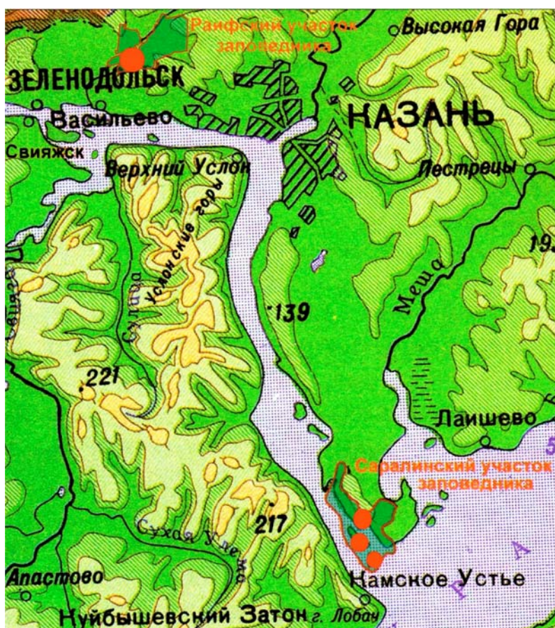
Рис. 1. Расположение участков Волжско-Камского заповедника и места сбора материала