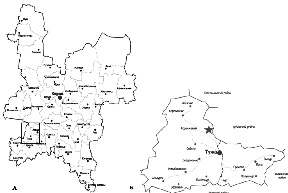
Рис. 1. Местонахождение памятника природы «Урочище «Васин бор»: А – карта Кировской обл.; Б – Тужинский р-н (увел.). ★ - памятник природы

которая характеризуется умеренной теплообеспеченностью и влажностью. Преобладает в бору вариация сильно- средне- и слабоподзолистых песчаных и супесчаных почв в сочетании с подзолисто- и торфяно-болотными, аллювиальными дерновыми и аллювиальными дерновыми глеевыми почвами [7].